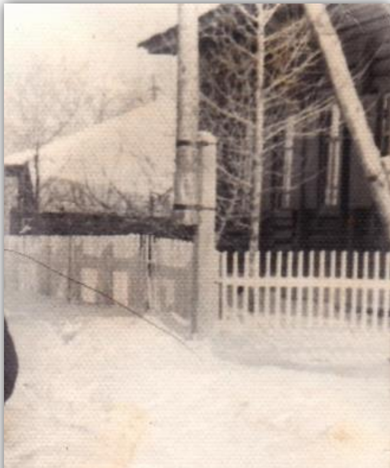
Очаг культуры - Баргадайская Изба читальня

История открытия библиотеки берет свое начало в 30-ые годы. Именно в 30-ые годы вышло специальное Постановление СНК РСФСР от 7 февраля 1930 года, «Об избах читальнях».