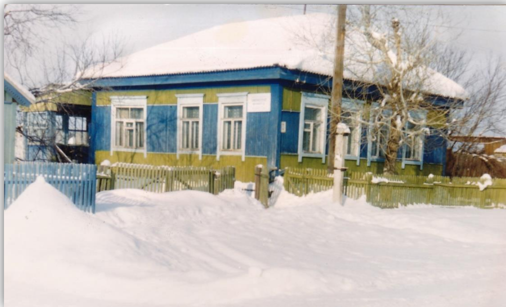
Здание, в котором находилась библиотека с 1969 по 1999 год

В конце 1960-х годов в библиотеке произошло важное событие, выделили отдельное здание. На этом месте стоял дом, который перевезли на улицу Беломестных, а это здание перевозят с другого места в центр села напротив клуба. Здесь располагался Баргадайский Сельский совет. В 1958 году Сельсовет нашего села объединяют с Кимильтейским, а это помещение, ненадолго, перестраивают в двухквартирный колхозный дом, затем отдают под библиотеку. После тесных комнат конторы колхоза имени Ленина а затем общежития, где библиотека ютилась почти 12 лет, работники культуры и читатели были рады такому просторному зданию, хоть и с печным отоплением.