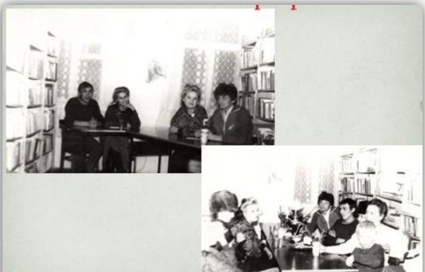
Молодежь села на мероприятии в библиотеке 1991 г.