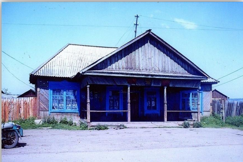
Контора "Колхоза им. Ленина"

Затем постепенно, по мере выполнения своих функций образования и просвещения сельского населения, изба читальня утратила свое значение, на смену ей пришли клубы и библиотеки. В этом учреждении оставили клуб, а библиотека начала свою работу в конторе «Колхоза им. Ленина» Баргадайского отделения №3 (на фото), размещалась она в небольшой комнате. Мебели почти никакой не было, стол, шкаф и лавки для читателей. Из архивного документа известно, что в 1960 году библиотека еще размещалась в конторе.